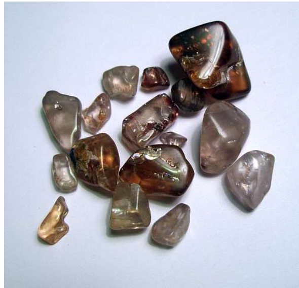
Zircon brut de Harts Range à gauche, à droite un lot prépoli