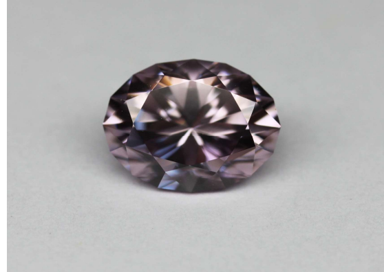
Zircon rose - grisâtre de 3,87 ct, Mud Tank, Harts Range, NT, Australie, taille ovale brillant. Taillé par Paul Pierce, SA en 2012 N° 16BNE