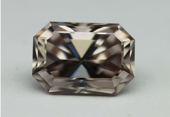
Zircon rose - brun, de 3,55 ct, Mud Tank, Harts Range, NT, Australie Taille émeraude mixte. Taillé par Paul Pierce, SA en 2012. N° 114 BNE